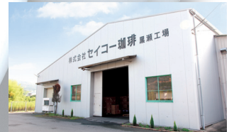
黒瀬工場 (有機JAS認定製造工場) Kurose factory (Authorized organic JAS factory) 东広島市黒瀬工厂 (有机JAS资格认证取得)