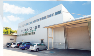
安浦工場 (有機JAS認定製造工場) Yasuura factory (Authorized organic JAS factory) 呉市安浦工厂 (有机JAS资格认证取得)

株式会社 Seiko Coffee 是一家本社位于广岛县的吴市，生产基地座落于广岛县的吴市和东广岛市的咖啡产品的制造企业。公司以挂耳式过滤咖啡为主打产品，商圈覆盖日本全国以及世界各地。