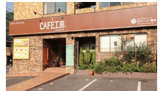
直営カフェ/CAFE工房 安浦店 Cafe Kobo Yasuura (Mail-order Section Cafe Kobo retail shop) 直営咖啡店 咖啡工房 安浦店