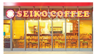
CAFE工房 阿賀店 Headquarter/A cafe SEIKO managed 直営咖啡店 阿賀店

美味しいドリップの淹れ方・飲み方。 How to make the drip coffee and how to drink. 美味挂耳式过滤咖啡的冲泡方法。 맛있는 트립을 타는 방법과 마시는 방법.