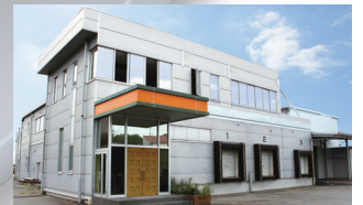
東広島物流センター Business headquarter Higashihiroshima Distribution Center 东広島物流中心 (营业总部)